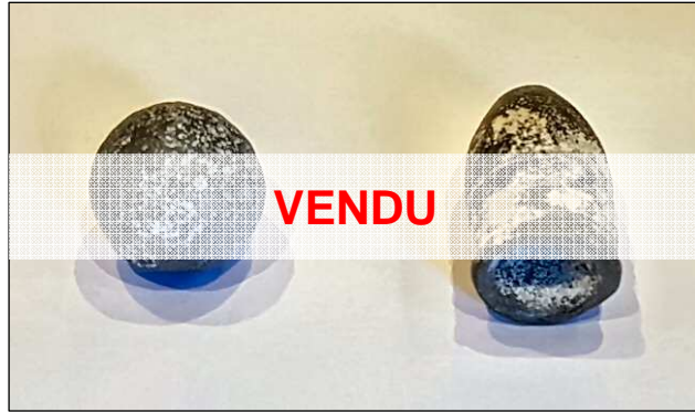
Balle ronde (cal .60) et minié (cal .54) de la guerre de Sécession. Bon état. Prix : 2 € pièce