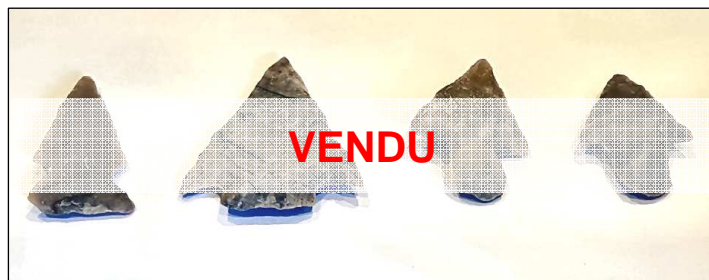
Véritables pointes de flèche indiennes en silex, en provenance d'Arizona. Etat impeccable. Prix : 10 € le lot.