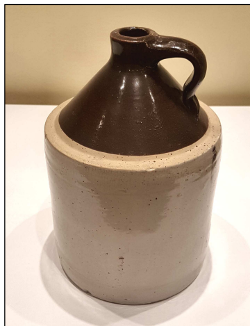
Cruche à whisky américaine en grès datant du XIX e siècle. Diamètre : 18 cm. Hauteur : 27 cm. Parfait état. Prix : 25 €