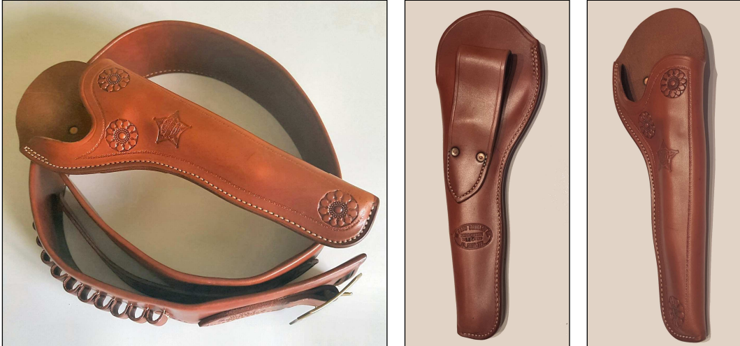
Ceinturon et holster en cuir pour Colt Frontier ou Lawman, calibre .45, canon de 5½". Réplique exacte du modèle porté par le sheriff Pat Garrett lorsqu'il abattit Billy The Kid en 1881. Au recto de l'étui est estampillé un fac-similé de son étoile de sheriff. Au verso : El Paso Saddlery Co, Texas, Pat Garrett, nr. 117/200 . Etat neuf. Prix : 150 €