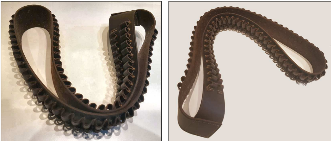
Cartouchière-bandoulière en cuir portée à l'époque du Far West et des guerres indiennes. 72 anneaux pour cartouches de calibre 45-70. Fabriqué par George Lawrence Co., Portland, Oregon. Taille 17. Etat neuf. Prix : 75 €