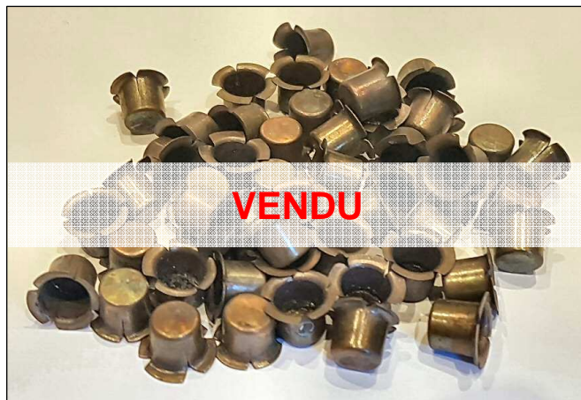
Véritable amorces à percussion de la guerre de Sécession pour fusil Springfield ou Enfield. Bon état. Prix : 10 € le lot