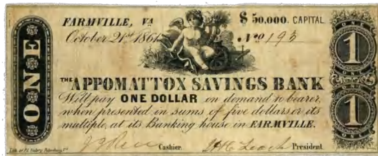
Billet d'un dollar émis en 1861 par l'Appomattox Savings Bank de Farmville